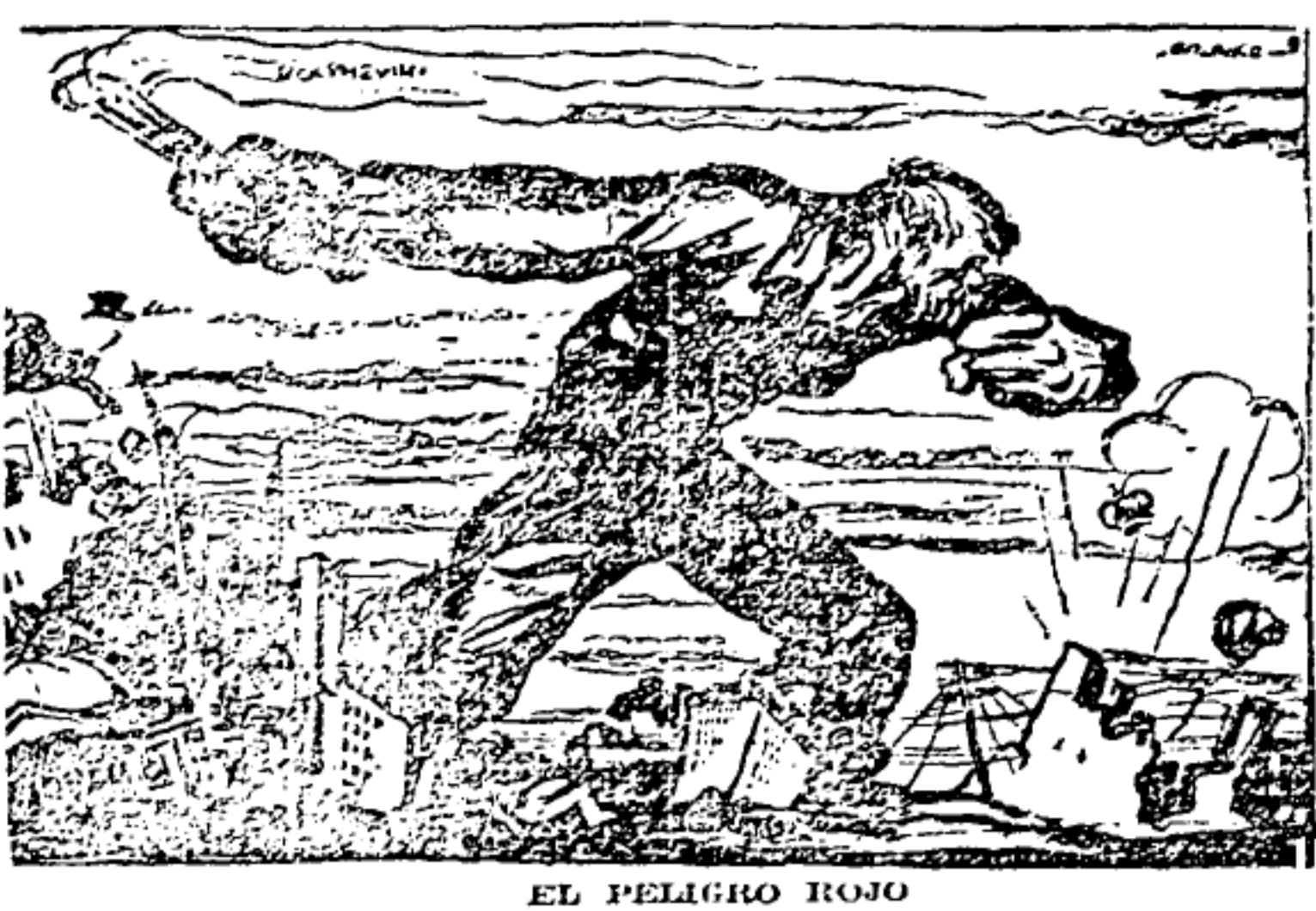
EL PELIGRO ROJO